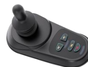
Diagramma di Controllo del Joystick

2. Esercitati a fermarti, andare avanti e indietro. Spingi il joystick e la sedia a rotelle si muoverà verso la posizione desiderata.